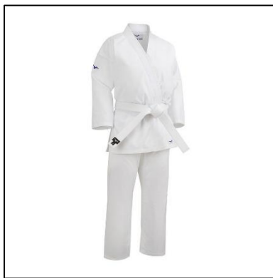
KARATE-GI BLANC AVEC OBI BLANC POUR DEBUTANT

Le plus rapidement possible, il sera demandé à chaque adhérent de se munir d'un KARATE-GI BLANC (tenue d'entraînement ou kimono de karaté), d'un OBI DE COULEUR en fonction de son grade (ou ceinture) et de MITAINES de Karaté (de couleur bleue ou rouge) . Ce matériel « minimum » favorisera la bonne pratique du Karaté au sein du Dojo, et ainsi assurera la progression de chacun tout au long de la saison.