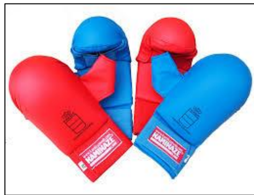
MITAINES DE KARATE BLEUE OU ROUGE

Les produits proposés par les magasins de sport généralistes sont idéaux pour l'initiation au Karaté. N'hésitez pas à demander conseil aux professeurs et aux anciens du club